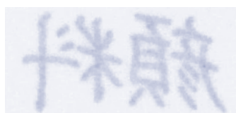
〈顔料インクの裏面〉