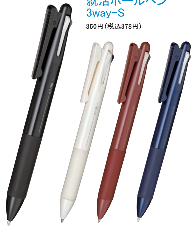
ブラック アイボリー レッド ブルー