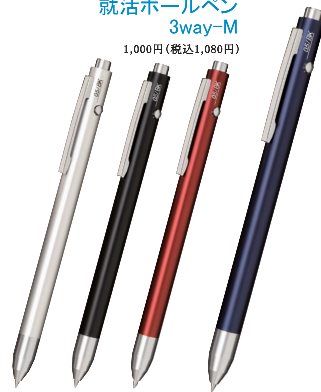
シルバー ブラック レッド ブルー