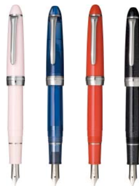
▲発売中のプロカラー500万年筆「四季彩」 (左から)さくら、うちみず、あかねぞら、ほしくず

金ペン先を好む万年筆ユーザーをはじめ、書き心地を含め万年筆をより楽しみたい方向けの展開です。