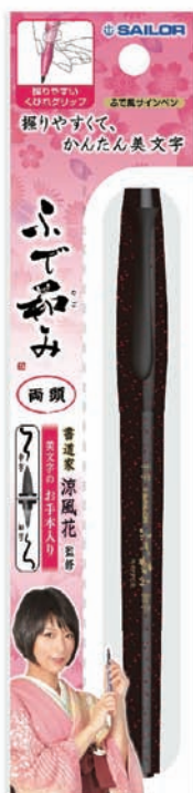
ふで和み 両頭 (中字・細字)