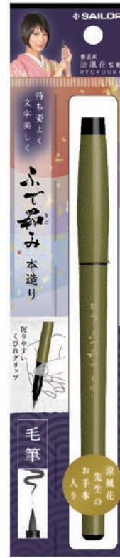
ふで和み 本造り 鶯(うぐいす)