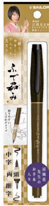
ふで和み 両頭 (中字・細字)