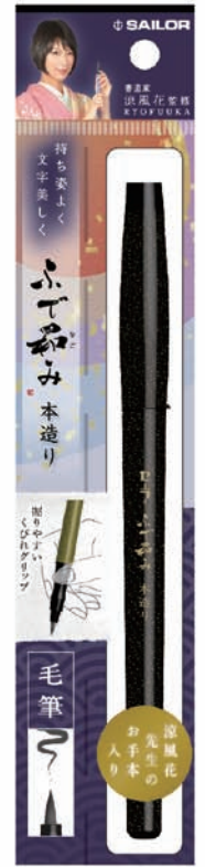
ふで和み 本造り 玄(げん)